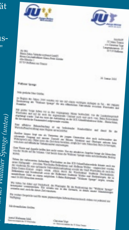
Gemeinsamer Brief an den RMV (rechts), JUler an der Wallauer Spange (unten)

Rhein-Main-Gebiet, möchten, dass sich die Deutsche Bahn und der RMV daher noch einmal verstärkt mit dem Bau der so genannten 'Wallauer Spange' auseinandersetzen. Mehr öffentlicher Nahverkehr bedeutet auch: Mehr Lebensqualität im Main-Taunus-Kreis!"