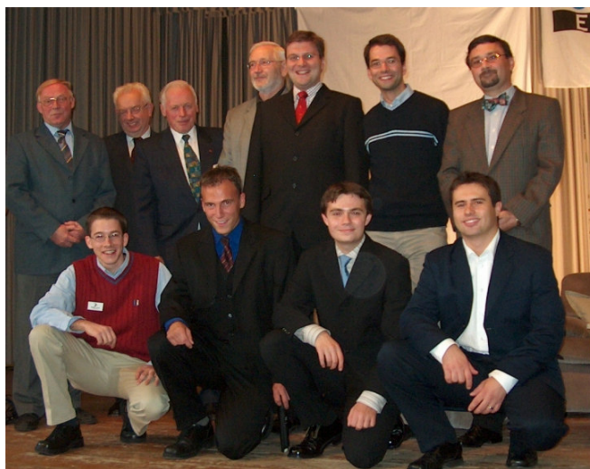
Die Vorsitzenden der JU Eppstein

ten und lieferte in seiner Rede einen glänzenden Motivationschub für alle anwesenden