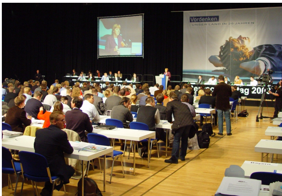
Die Delegierten des JU Deutschlandtags hören Angela Merkel bei ihrer Rede zu

Mehr Generationengerechtigkeit einzufordern und massiver gegen den Schuldentrend anzugehen. Die Bayerischen Dele-